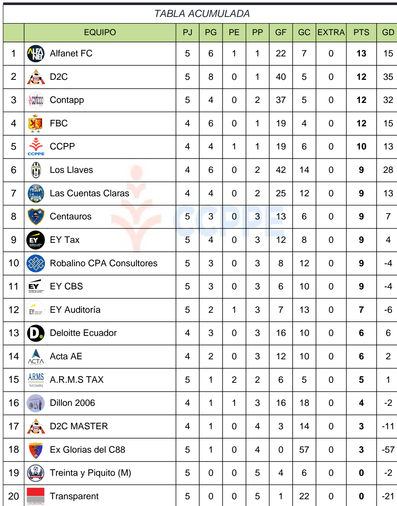
TABLA DE POSICIONES - CATEGORÍA MASCULINO